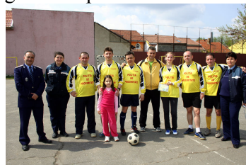
Imagini de la activitatea “Fair play”

Ziua de miercuri a început prin minunata apariție a Soarelui. Sunt convinsă că activitățile noastre au făcut ca Soarele să-și întoarcă fața spre noi, iar natura s-a trezit la viață. Urmău alte activități la care aveam să particip.