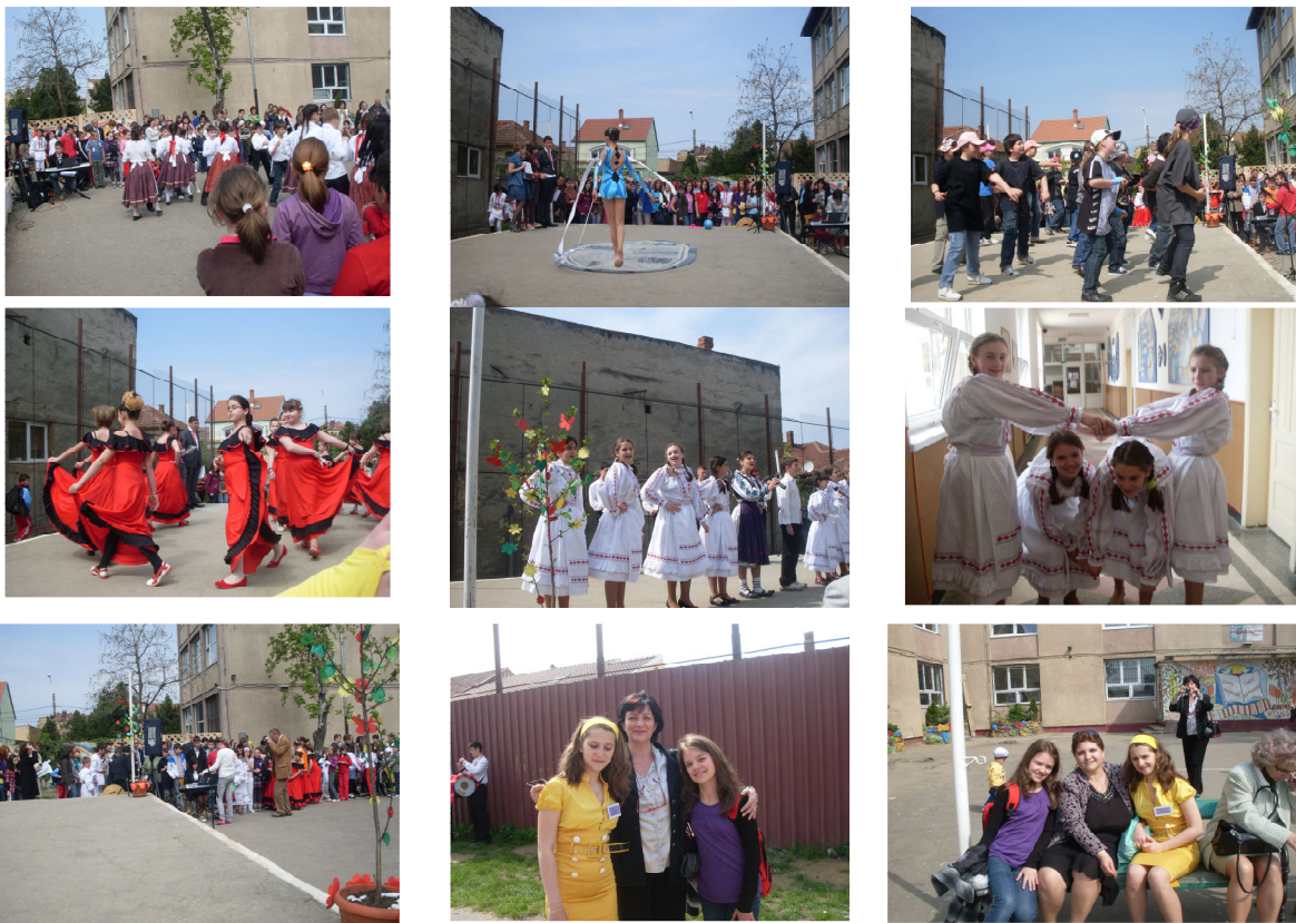
Imagini de la spectacolul artistic