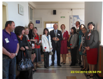
Imagini de la activitatea Ieri elev, azi părinte

Astfel, activitate după activitate, nici nu știu cum a trecut timpul și am ajuns și la ziua de vineri, 23 aprilie, ultima zi din cadrul Zilelor Școlii “Nicolae Bălcescu”, care a debutat cu două concursuri “ Cangurul matematic ” și “ Eurojunior ”, la ciclul primar, precum și cu concursul “Haiku noi”.