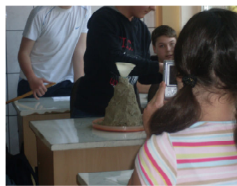
Imagini de la activitatea Sesiunea de comunicări a elevilor din clasele V – VIII