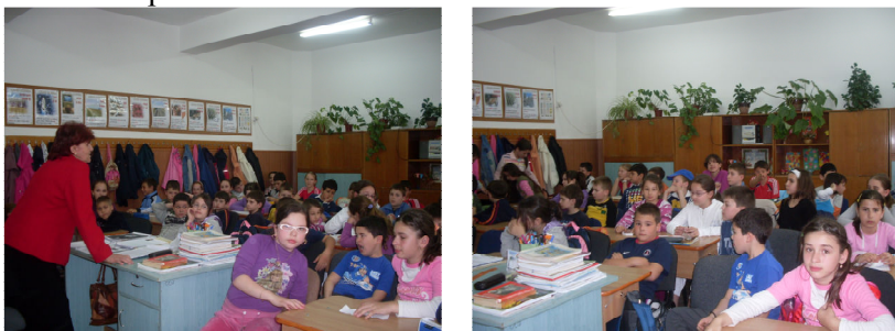
Imagini de la activitatea Evocare – Nicolae Bălcescu